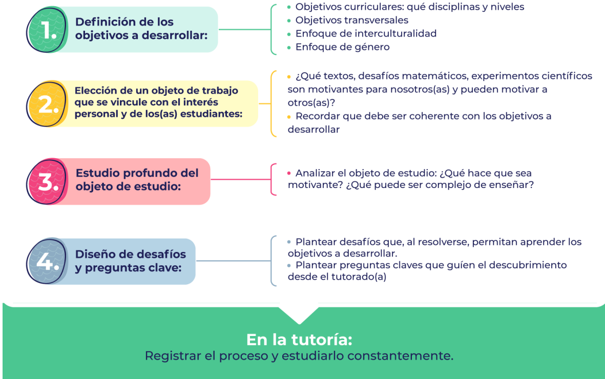
Figura 2. Proceso de construcción de temas de tutoría

A partir de lo anterior, el equipo de innovación completo inició la creación de nuevos Temas de Tutoría, proceso que integró la práctica observada y retroalimentada de estos temas y un acompañamiento personalizado de 1 a 2 horas para responder dudas e inquietudes que surgieran del trabajo individual. Finalmente, como producto, cada monitor(a) logró la construcción de un nuevo tema, pasando a tener tres temas en su catálogo personal y ampliando el catálogo de cada país.